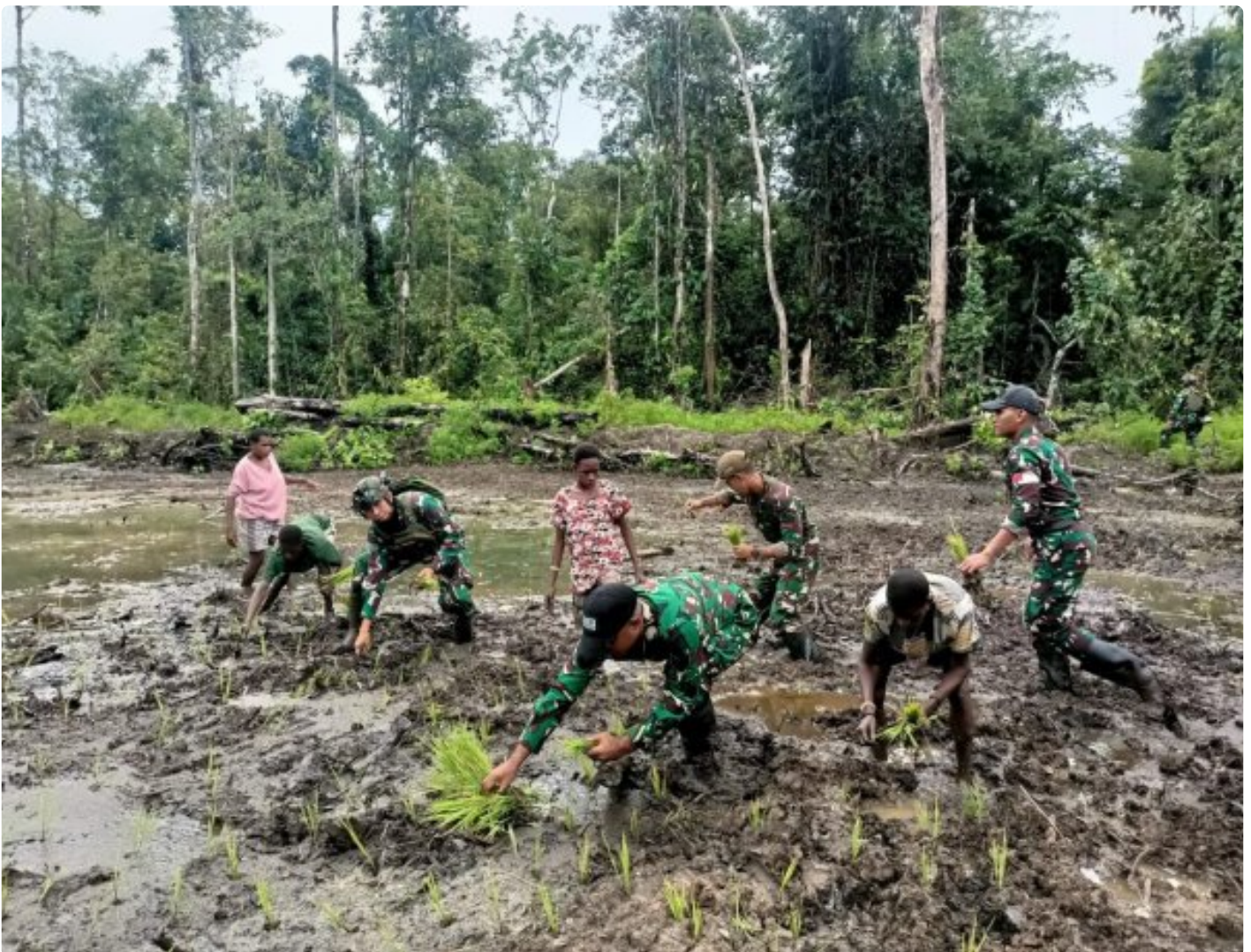
Foto: Satgas Pamtas Mobile RI-PNG Yonif 503/Mayangkara menggagas program ketahanan pangan yang melibatkan langsung warga Kampung Mumugu, Distrik Krepkuri, Kabupaten Nduga, Selasa (07/01/2025).

NDUGA- Dalam upaya membangun kesejahteraan masyarakat di wilayah penugasan Papua Pegunungan, Satgas Pamtas Mobile RI-PNG Yonif 503/Mayangkara