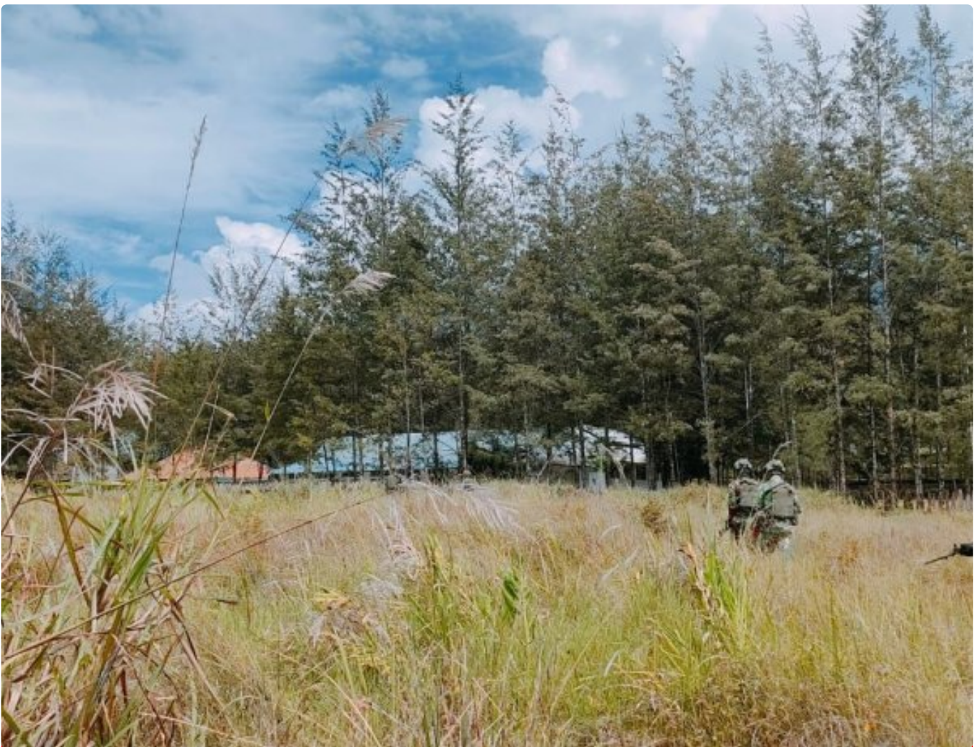
Satgas Yonif 323 Amankan Anggota OPM terduga pelaku tindak Kriminal

Satgas Mobile Yonif 323/Buaya Putih Kostrad berhasil menangkap salah satu anggota Organisasi Papua Merdeka (OPM) yang diduga terlibat dalam sejumlah tindak kriminal di wilayah Papua, Kabupaten Puncak, Penangkapan ini dilakukan